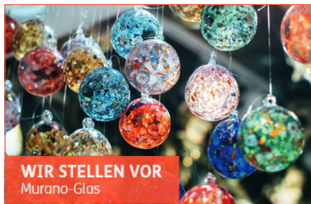
WIR STELLEN VOR Murano-Glas

Murano-Glas ist für seine lebendigen Farben und künstlerischen Muster bekannt. Jedes Stück Murano-Glas wird von Hand gefertigt, oft von Meistern, die ihre Techniken über Generationen hinweg verfeinert haben. Die Insel Murano ist seit Jahrhunderten ein Zentrum der Glasherstellung, und die Kunst des Glasblasens ist tief in der venezianischen Kultur verwurzelt.